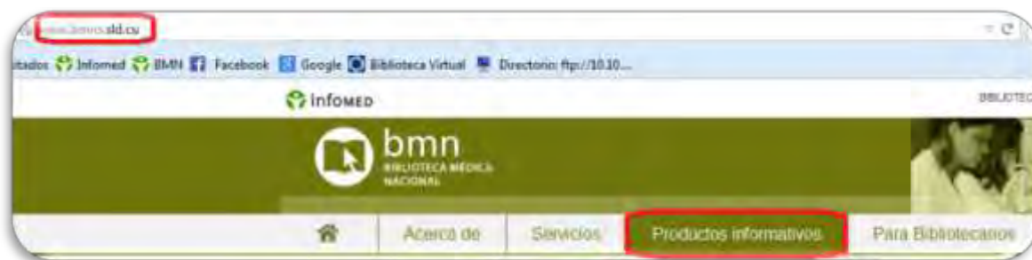
Fig.7. Página WEB BMN

Los usuarios con dominio sld.cu pueden acceder al sitio web de la BMN en la sesión Productos informativos http://www.bmns.sld.cu/ . Los interesados se subscriben a una lista de distribución conservamed@listas.sld.cu y la reciben por correo electrónico. Fig.7,8 y 9