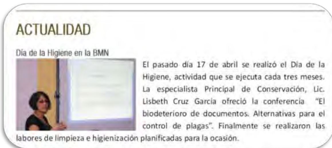
Fig.4 Sección Actualidad

ACTUALIDAD: Ofrece una alternativa en el mundo de la información. Noticias de actualidad, tanto nacionales como internacionales en el campo de la conservación documental. Incluye eventos y cursos, Fig.4