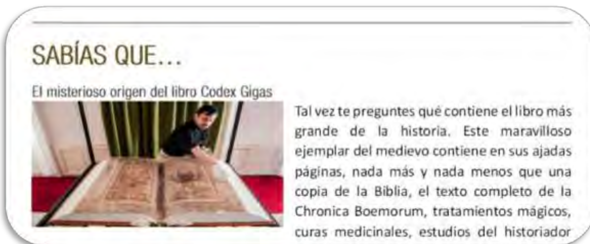
Fig.5 Sección Sabías Que...

SABÍAS QUE: Contiene curiosidades interesantes sobre el mundo de las bibliotecas y los libros. Aumenta tus conocimientos sobre cultura general, Fig.5