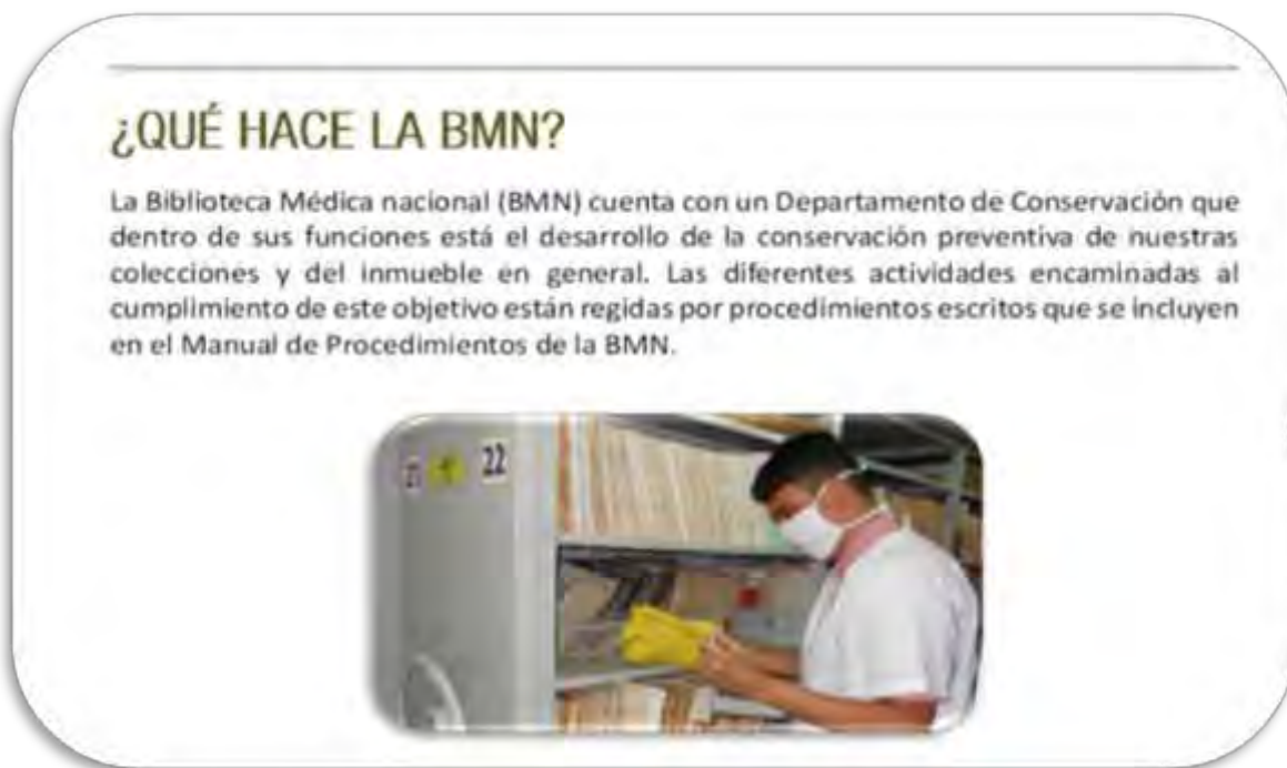
Fig.3 Sección Qué Hace la BMN

QUÉ HACE LA BMN: Refleja la experiencia práctica de la institución sobre el tema principal que abarca el boletín. Contiene imágenes de nuestro quehacer, Fig.3