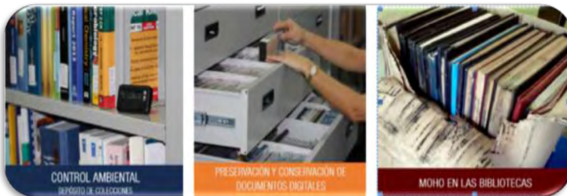
Fig.2 Tema Principal

También forma parte de la portada la primera sección del boletín que es el TEMA DEL NÚMERO: Cada número abarca un tema específico, contiene una revisión bibliográfica sobre el tema, destacando conceptos y tendencias actuales, con bibliografía al final del artículo ordenadas y acotadas en Normas Vancouver. Al tema lo acompaña una imagen relacionada con el contenido. El artículo puede incluir entre 400-600 palabras. Fig.2